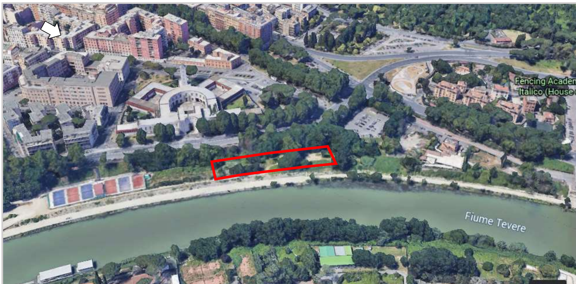
Ortofoto 3d del compendio da valorizzare

Destinazione d'uso futura: sportiva/ricreativa