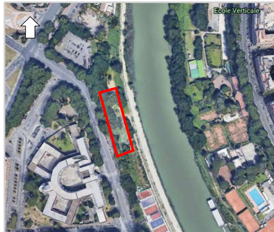
Ortofoto 2d del compendio da valorizzare