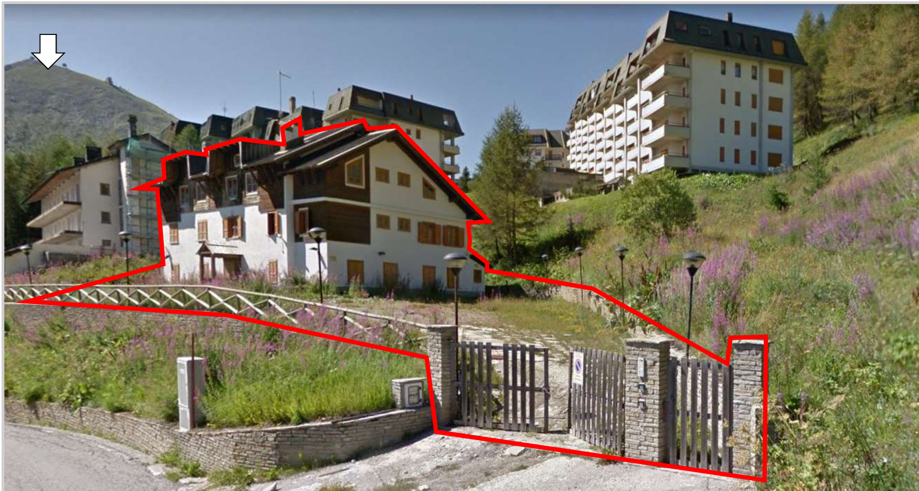
Foto sedime da valorizzare