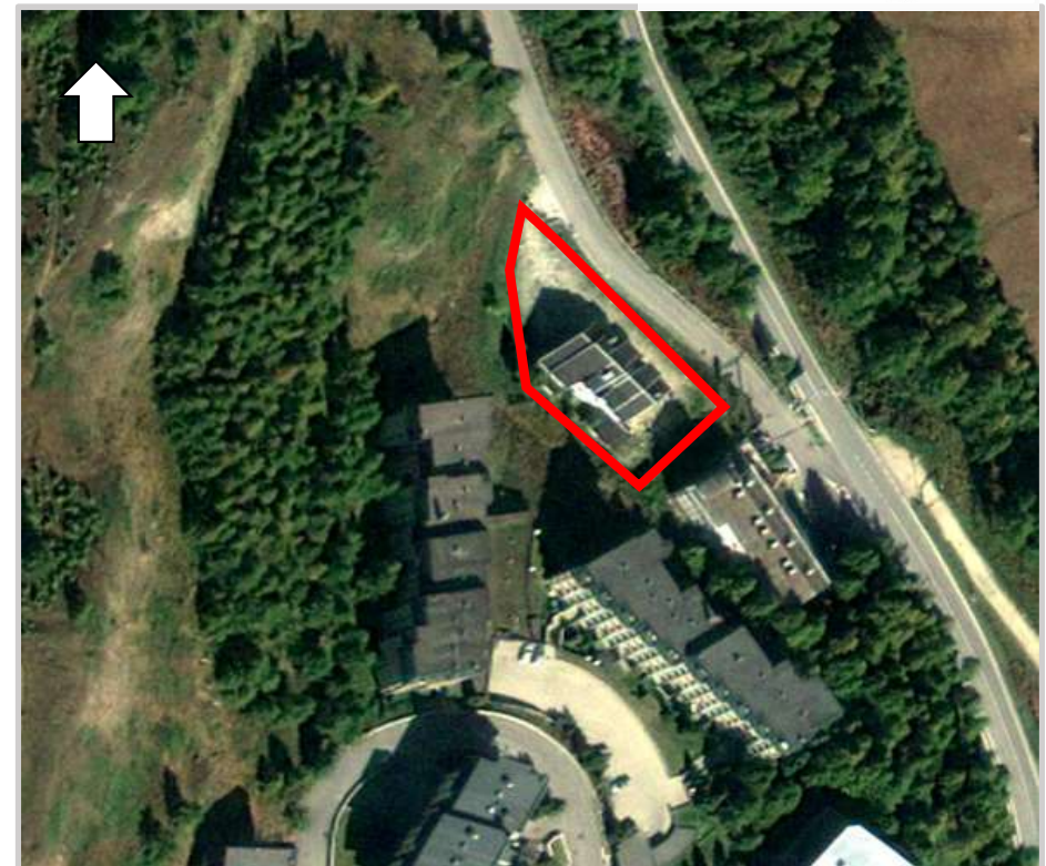
Ortofoto 2d del sedime da valorizzare