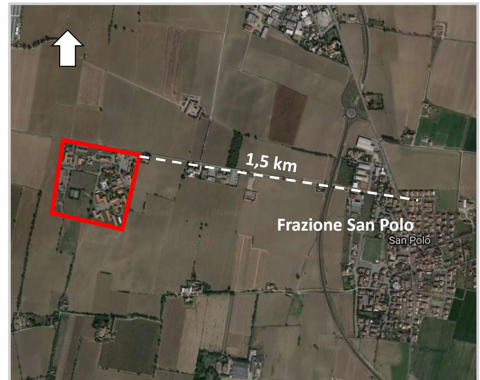
Ortofoto 2d del sedime da valorizzare