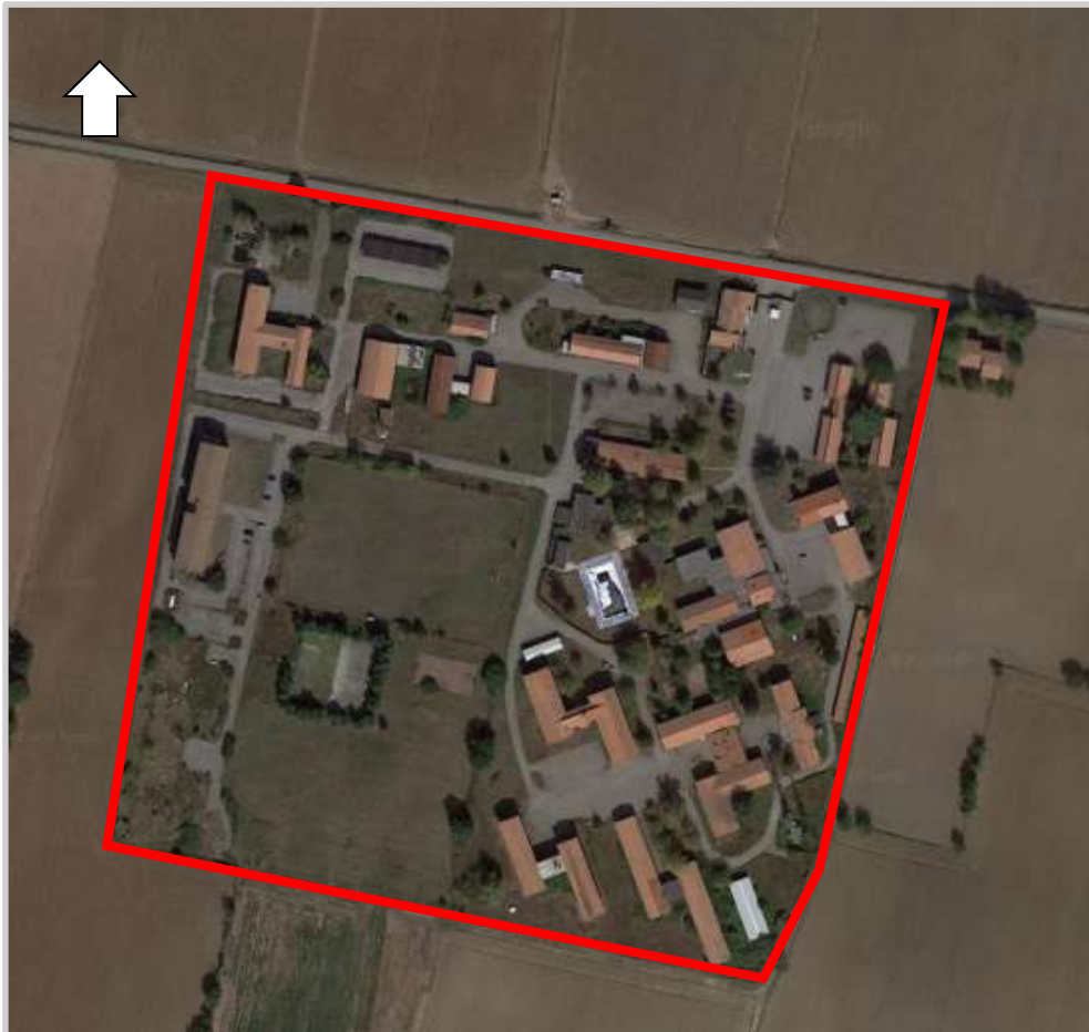
Ortofoto 2d del sedime oggetto di valorizzazione