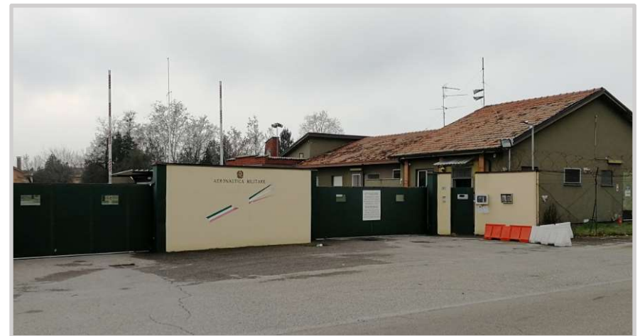
Foto ingresso sedime e manufatti vari