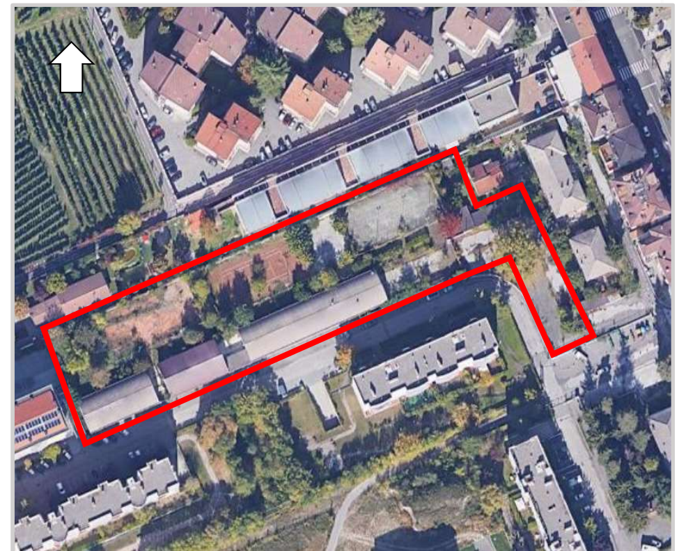
Ortofoto 2d del sedime da valorizzare