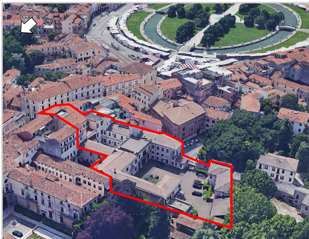
Ortofoto 3d con indicato il sedime da valorizzare

Destinazione d'uso futura: turistico-ricettiva/ senior housing