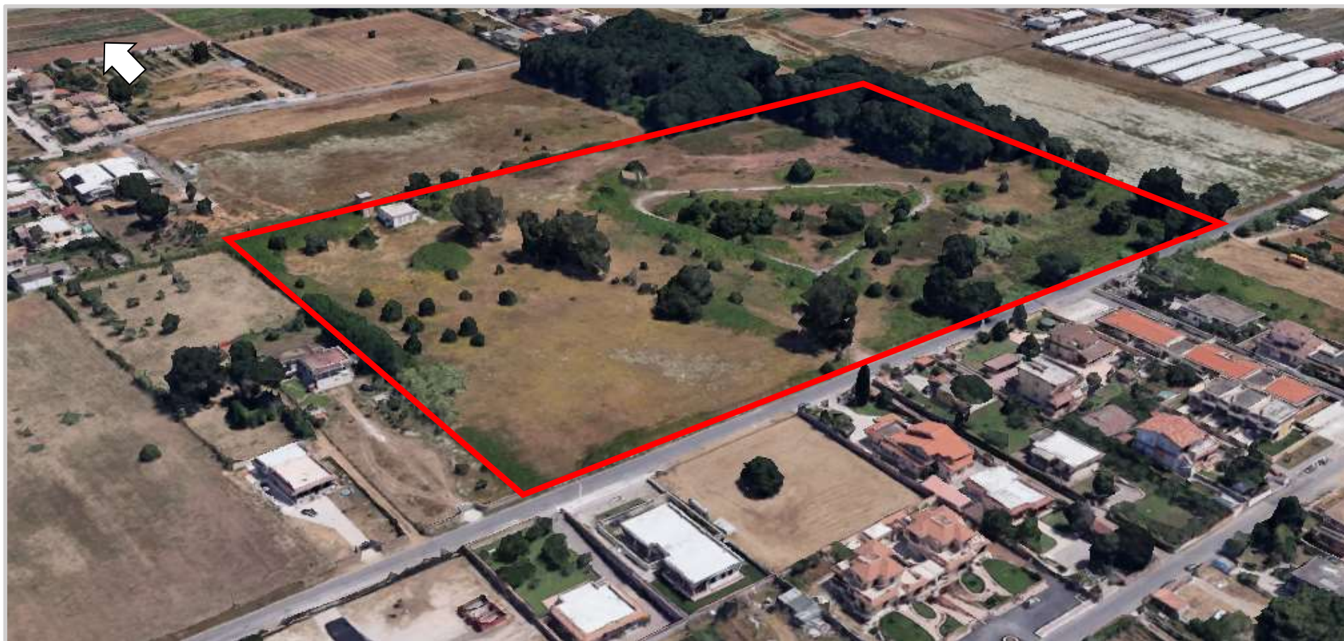
Ortofoto 3d del compendio da valorizzare

Destinazione d'uso futura: sportiva/ricreativa (categoria prevalente) – commerciale/turistico ricettiva/servizi