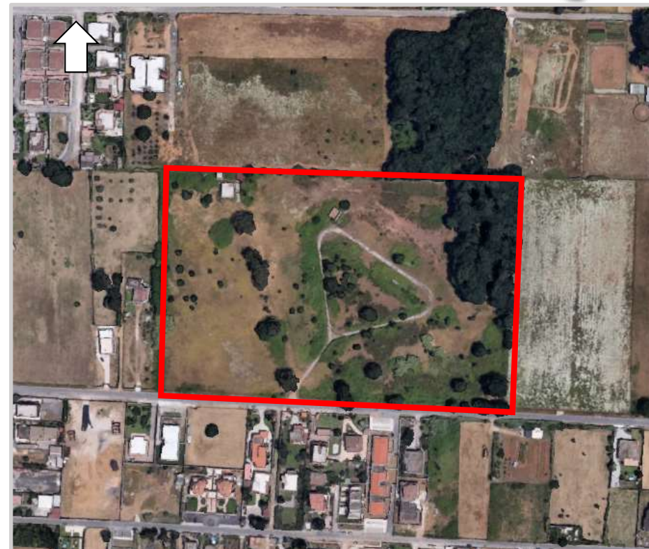
Ortofoto 2d del compendio da valorizzare