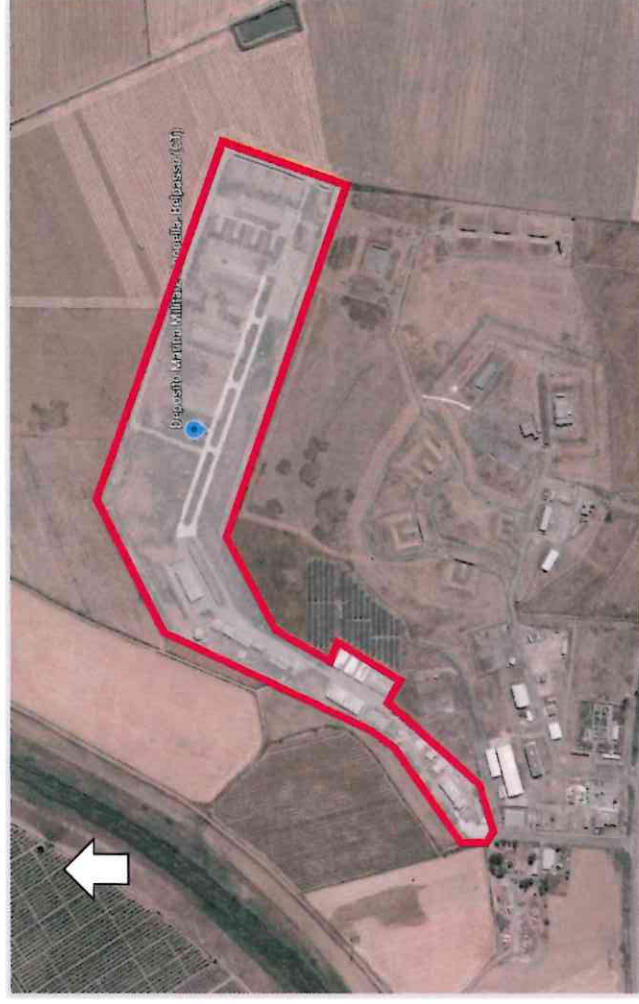
Ortofoto 2d del sedime oggetto di valorizzazione