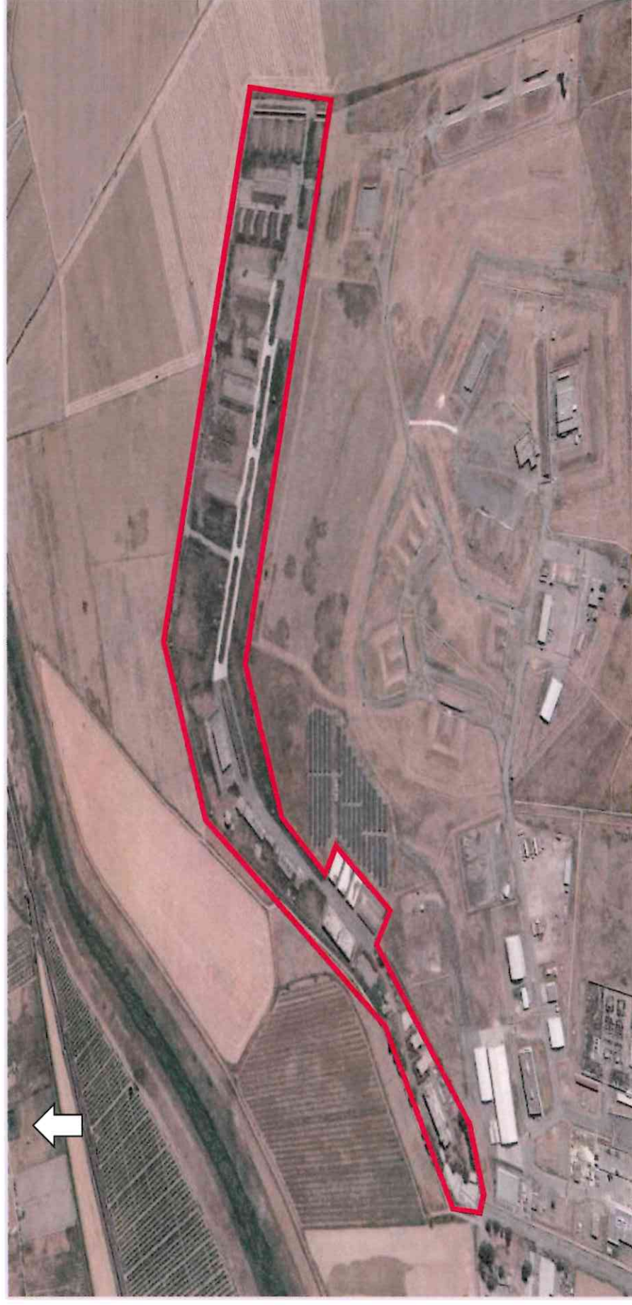
Ortofoto 3d del sedime oggetto di valorizzazione

Destinazione d'uso futura: opificio/logistica